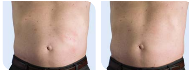
Direkt nach der Infusion

Subkutane Immunglobulintherapie täglich bis zu alle 2 Wochen