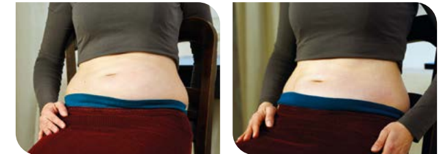
Direkt nach der Infusion

Subkutane Immunglobulintherapie alle 2 bis 4 Wochen